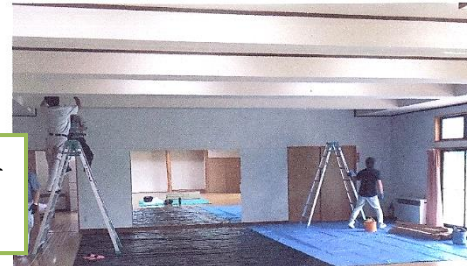
鍋倉ふれあいセンター のLED化