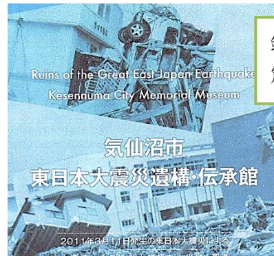
鉛行政区 震災復興視察