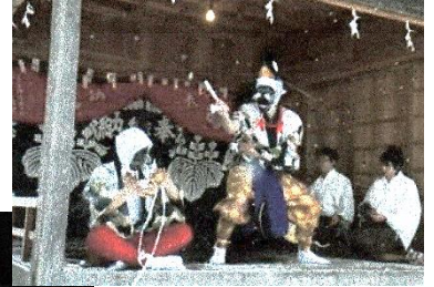
上根子神楽 沖縄合同 公演会