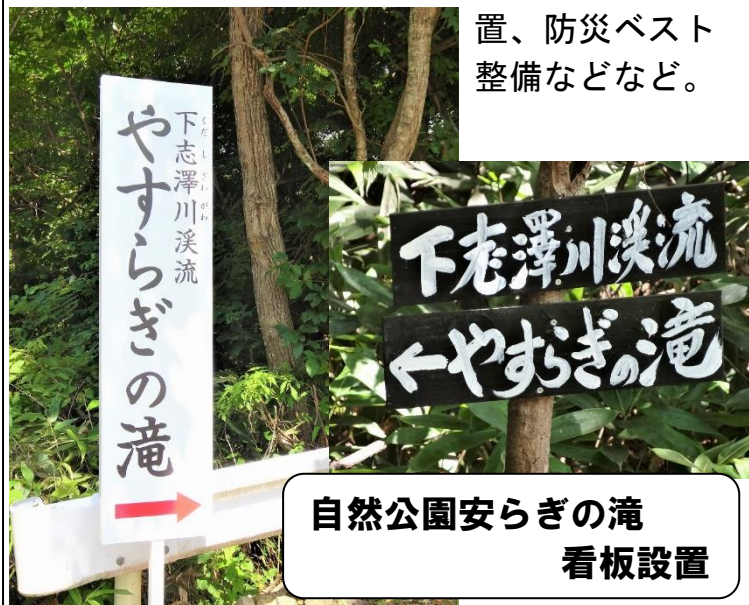
自然公園安らぎの滝 看板設置

防犯灯の新設・LED化、公民館の修理、公民館備品整備、防災倉庫、運動公園物置設置、防災ベスト整備などなど。