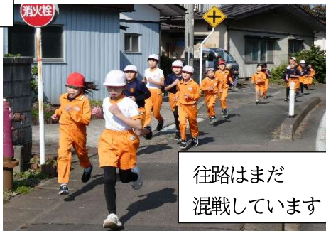
往路はまだ 混戦しています