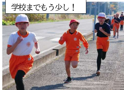
学校までもう少し!