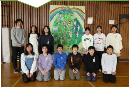
6年生からのメッセージ