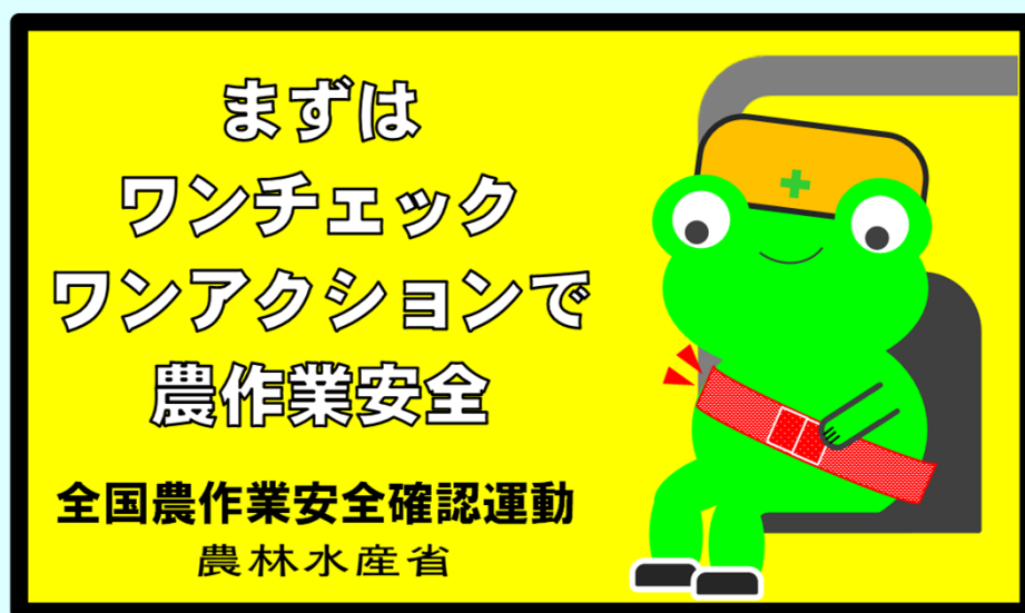
【平成31年全国農作業安全確認運動ステッカーデザイン】

農林水産省生産局 技術普及課生産資材対策室（安全指導班） TEL 03-3502-8111（内線：4774）