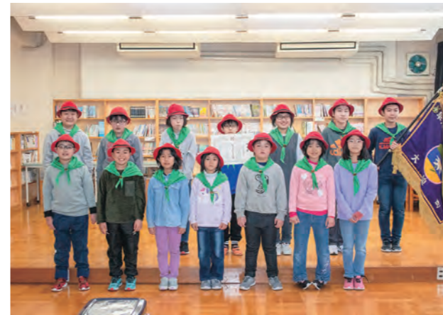
▲内川目小の皆さん