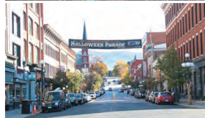
▲ベルンドルフ市(写真上)とラットランド市(写真下)の街並み

【展示期間】3月3日(水)～15日(月) 【会場】ぷらっと花巻(イトーヨーカドー花巻店2階)