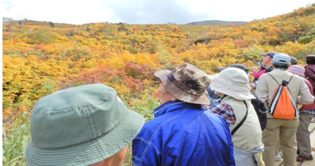
昨年の須川高原への自然探訪教室