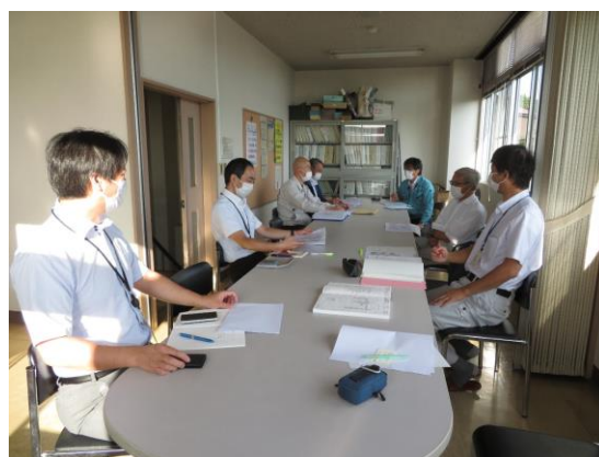
工事日程等について打ち合わせる市職員と工事業者の皆さん