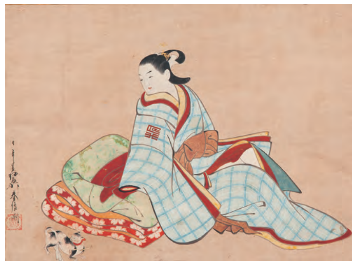
▲梅翁軒永春「遊女と猫」(部分)

◆小中学生は、まなびキャンパスカードの提示で、全ての展示を無料でご覧になれます(小学生は同伴者1人も無料)