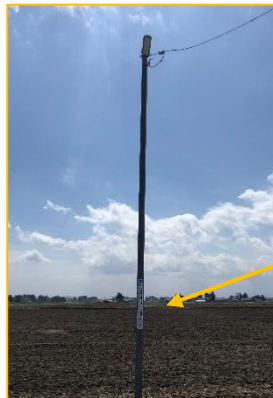
支柱新設の 街路灯