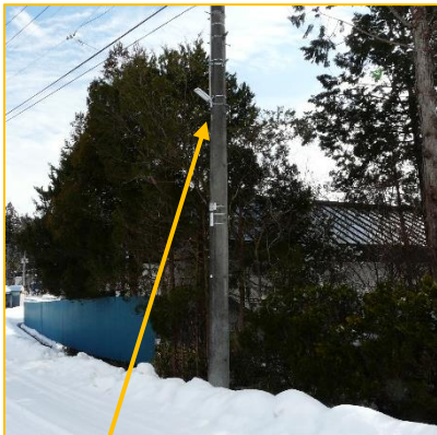
電柱添加の街路灯 (新堀7区)

また、支柱新設の街路灯やカーブミラーには当会議で設置したことを示すために表示シールの貼り付けを行っており、新堀地区イメージキャラクター米田くんの広報活動にもなるとともに街路灯の電球の球切れや万が一カーブミラー等に不具合が生じた際の間合せ先にもなっております。球切れや故障等何かお気づきの際には、記載してあります新堀地区コミュニティ会議（TEL/FAX 45-3730）までご連絡をお願いいたします。