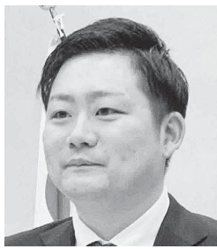
議員 小森田 郁也

米の集荷が12月下旬まで続くことから、一等米比率や収穫量などが確定し、今年産の状況が明らかになった時点において、農業関係団体の意見を伺いながら、必要に応じて農業経営の安定化につながる支援策について検討していく。