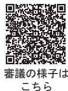
審議の様子は こちら

答弁・・・花巻駅前と旧総合花巻病院跡地のそれぞれに建設した場合の事業費についてと、建設した際のイメージを市民に比較できる形で示せるような調査をしたいというものである。