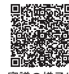
審議の様子は こちら