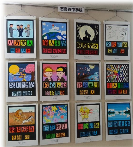
<花巻市総合文化祭展示>