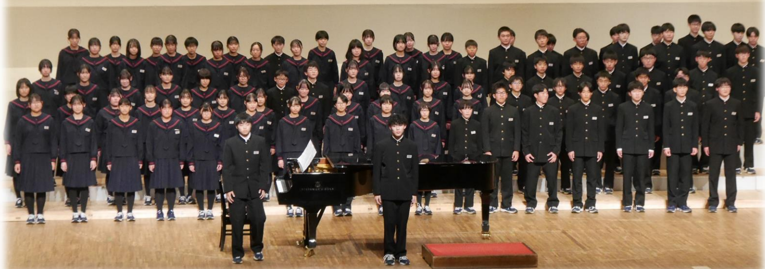
<花巻市中学校総合文化祭 2学年ステージ発表>