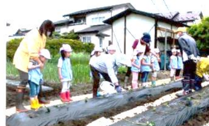
【二枚橋駅前 園児との六三会との交流】