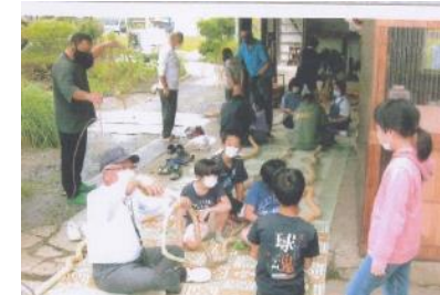
【二枚橋 しめ縄作り】