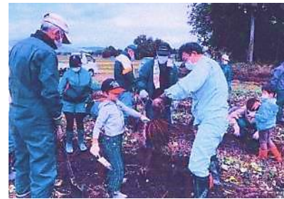
【狼沢 農業体験(さつま芋)】