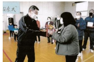
【上湯本二 卓球・輪投げ交流】