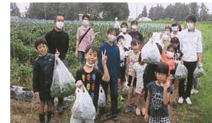
【北湯ロー 農業体験(さつま芋、ピーマン)】