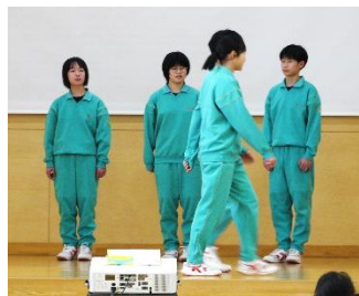
<あいさつを返さず通り過ぎる悪い例>

次に応援団長と各専門委員長から、応援団活動、専門委員会の活動内容について説明がなされました。