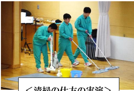
<清掃の仕方の実演>