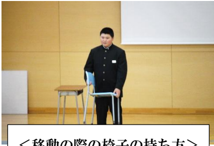
<移動の際の椅子の持ち方>

部活動紹介では、各部5分間の持ち時間をいっぱいを使って、普段の練習の様子を紹介し、部員獲得を目指しました。吹奏楽部は、MONGOL800の「小さな恋のうた」を演奏し、会を盛り上げてくれました。