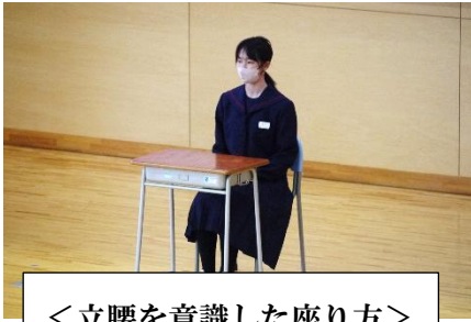
<立腰を意識した座り方>