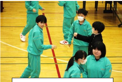
<あっち向いてホイ>