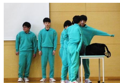
<邪魔にならないよう着替える良い例>