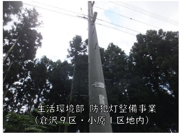
生活環境部 防犯灯整備事業 (倉沢9区・小原1区地内)

今年度事業について各行政区の計画に基づき進行していただいています。側溝蓋を設置した館迫3区地内では、脱輪などの事故防止、防犯灯のLED化を実施した倉沢9区・小原1区地内では省エネによる電気料金とCO2の削減、維持管理費が削減できる等、地域の課題解決に向けた事業内容となっています。