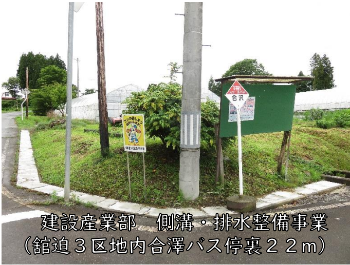
建設産業部 側溝・排水整備事業 (館迫3区地内合沢バス停裏2.2m)