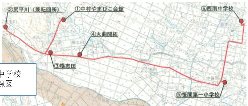
笹間第一小・西南中学校 スクールバス路線図

笹間第一小・西南中スクールバス（中学校下校便） 利用人数：7名 運行車両：小型バス1台 運行区間：西南中学校～中村やまびこ会館停留所 運行回数：1回 乗車時間：約21分