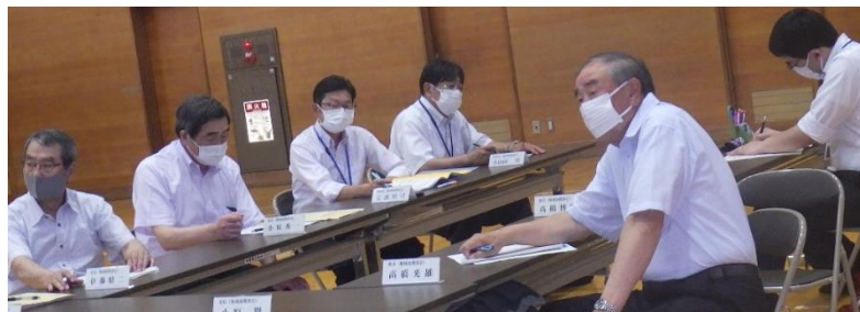
地域連携部会の部会員の皆さんと事務局担当職員