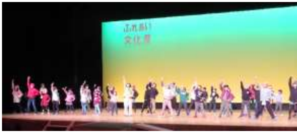
ふれあい文化祭ステージ発表 12月7日(木)