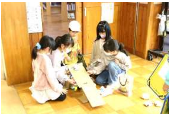
1・2年 おもちゃランド