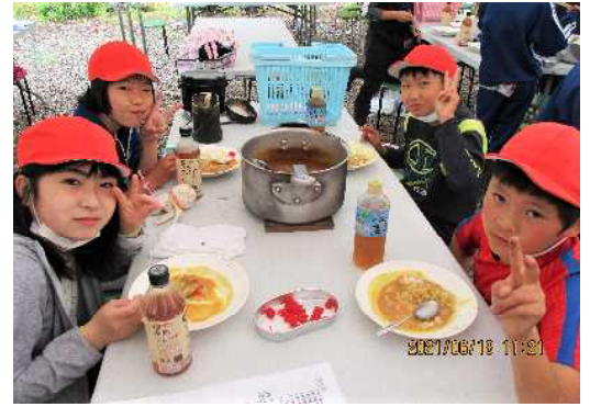
かまどの管理，材料の仕込みや飯盒での炊飯など班全員で協力し，美味しいカレーができました！