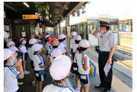
券売機で切符を買い，ホームで駅員さんのお話を聞く2年生