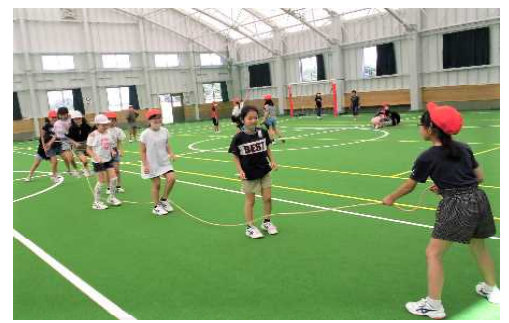
ダムやゴミ焼却場の設備を見学して働き等について学び，昼食後はクリーンドームで遊ぶ4年生

※ 6月28日（月），29日（火），7月5日（月），6日（火）の4日間，10地区で「地区懇談会」を開催しました。PTA社教部の方々をはじめ出席くださいました皆様，本当にありがとうございました。