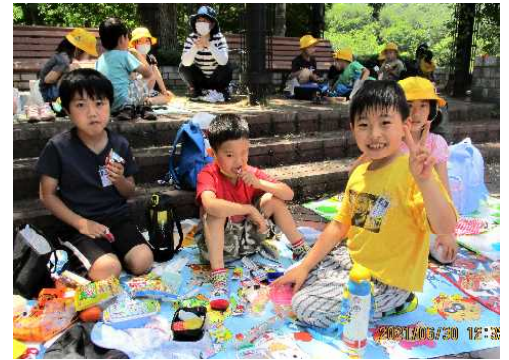
アスレチックで楽しみ，おいしいお弁当を食べる1年生