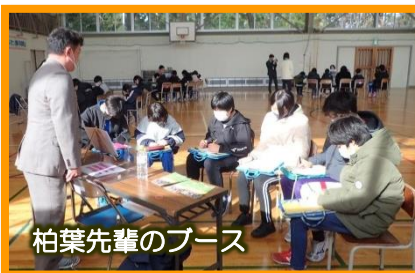
柏葉先輩のブース

NPO法人未来図書館様のご支援により、8名の講師の皆様をお迎えして、未来パスポートプログラムを実施しました。8名の皆様からは、それぞれの職種で活躍する先輩として、自身の生き方や思い、現在の仕事のこと等を教えていただきました。