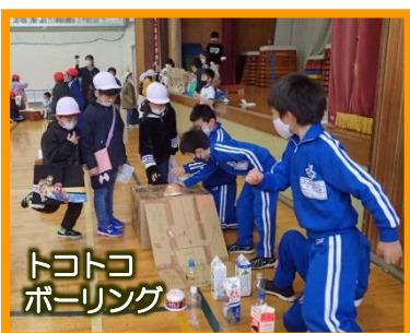
トコトコ ボーリング