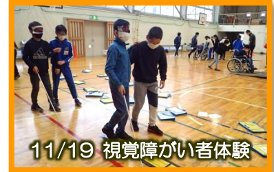
11/19 視覚障がい者体験

車いす体験・視覚障がい者体験・高齢者疑似体験・手話体験・点字体験を通して、不自由な方々の困難を理解するとともに、障がいの有無に関係なく優しい気持ちで人と接することの大切さに気づいていたようで、いつも以上に優しく支えあって活動している子ども達の姿が素敵でした。