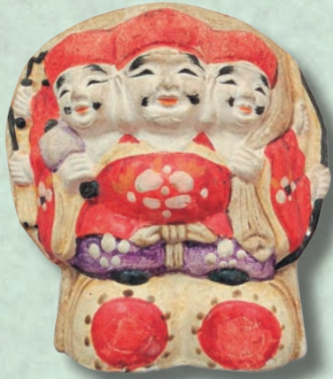
▲花巻人形「三面大黒天」