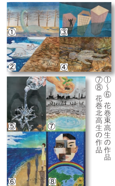
⑦①②③④⑤⑥ 花巻東高生の作品 花巻北高生の作品