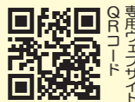
専用ウェブサイト