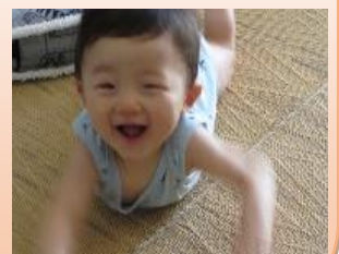
赤ちゃんの笑顔が一番