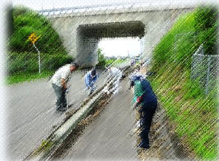
昨年の「クリーン大作戦」の様子