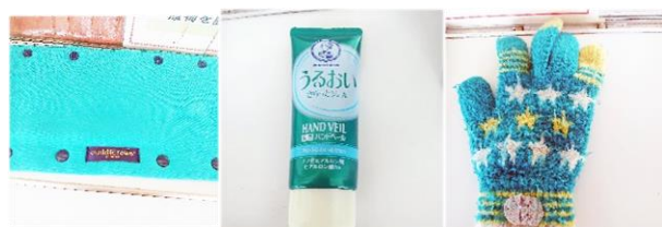
(ポーチ) (ハンドクリーム) (手袋)

社会体育館入口付近で拾得した品々です。これらは社会体育館に入ってすぐのカウンターにそのまま保管しています。