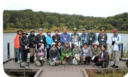
自然探訪教室 (八幡平 大沼周辺紅葉の探訪)