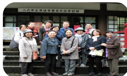
婦人学級移動研修 (二戸の歴史と文化を学ぶ)