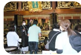
ウォーキング教室地区内の寺院を訪ねる (延妙寺副住職)