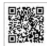
アンドロイド端末