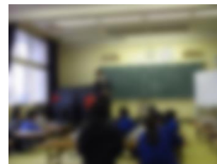
弁護士によるいじめについての授業(5・6年)