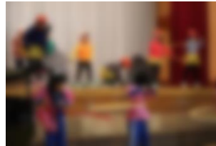
ももたろうたち (2年)

一人の輝きが二つになったら、二倍の明るさになります。百人を超える輝き一つに合わさったら、一人の百倍を超えます。約百倍の輝きとなつて、今日の学習発表会ができました。キラキラの学習発表会です。