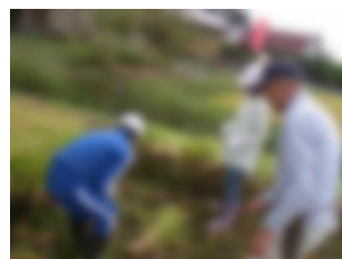
平藤ご夫妻による田んぼでの稲刈り体験(5年)