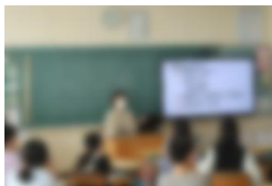
認知症地域支援推進員による孫世代のための認知症講座(4年)