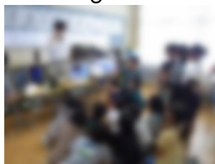
花巻市下水道課による下水道の学習(4年)