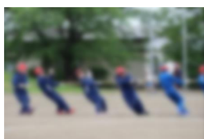
お助け綱引き (3・4学年)