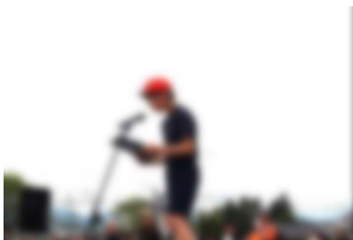
成績発表 (6年採点係)