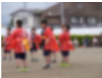
笹間さんさおどり (3・4学年)