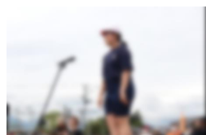
終わりのことば (6年児童会長)