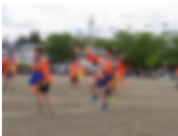
田植えおどり (5・6学年)