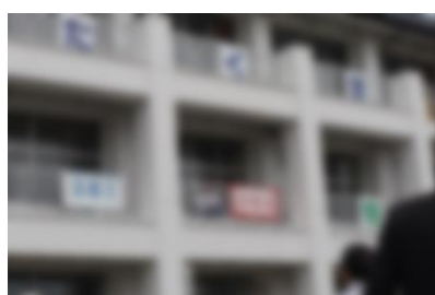
優勝：赤組 準優勝：白組 応援賞：白組