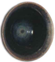
門馬経臣 《黒油柴変茶碗》 φ17.0×H7.0cm