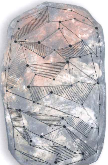
門馬経臣 《ALMA》 2022年