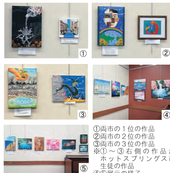
①両市の1位の作品 ②両市の2位の作品 ③両市の3位の作品 ※①～③右側の作品がホットスプリングス市生徒の作品 ④⑤展示の様子

ばれた両市の作品は、国際姉妹都市連盟がウェブ上で開催する作品展に出展されます。国際姉妹都市連盟主催の作品展は下記URLで公開予定です。ぜひご覧ください。