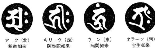
ア ク（北） 釈迦如来 キリーク（西） 阿弥陀如来 ウ ン（東） 阿闍如来 タラーク（南） 宝生如来

※筆者の調査では、仏塔の塔身の四方に彫られた梵字は、方角が合っていません。これは、いつの時代か地震などで崩壊した時に、修復した人が梵字の意味が分からなかったからでしょう。