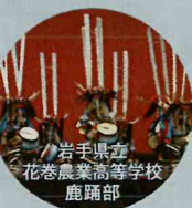
岩手県立 花巻農業高等学校 鹿踊部