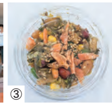
③ ミャンマーの代表料理「ラペットウ」

お米が炊き上がる間、それぞれの出身地の料理である「バインミー(ベトナムの代表的なサンドイッチ)」と「ラペットウ(発酵したお茶の葉を使ったミャンマーの代表的なサラダ)」が作られ、参加した実習生の皆さんは、笑顔とともに、日本とそれぞれの祖国の味を持ち帰りました。