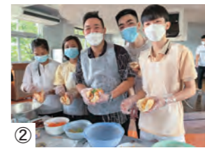
② ベトナムの代表料理「バインミー」を作る様子