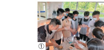
① おにぎり作りの様子

当日は、ミャンマーやベトナムから来日した合計16人の実習生が参加。持ち帰りができるおにぎりやサラダなどの作り方を学びました。普段の座学での研修も熱心に学んでいるようですが、いつもの研修会場を離れて行う実践的な研修はいっそう興味深い様子。調理器具や食材の名前、「焼く」「炊く」といった調理に関する日本語を学びながら、「おにぎり作りは初めて」「楽しい」「おいしそう」と生き生きとした表情で積極的に参加していました。