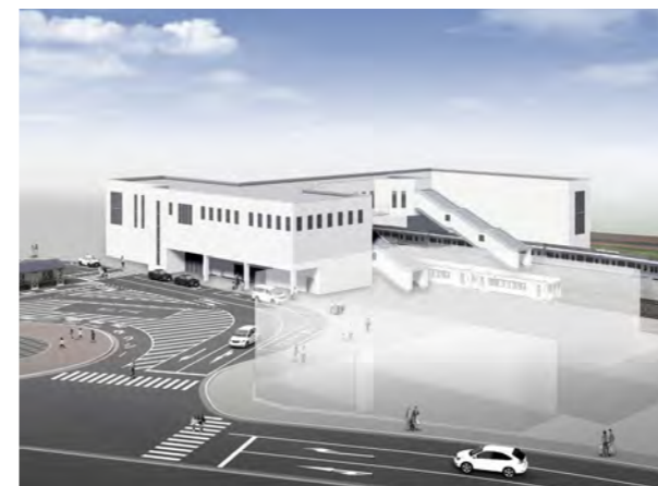
▲半橋上駅案のイメージ図