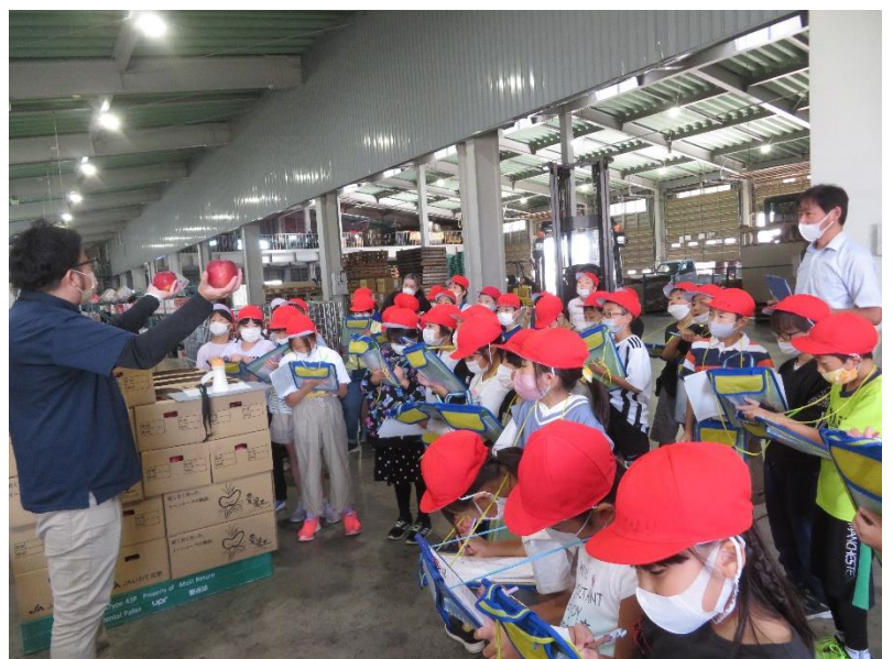
JA 岩手花巻園芸センター