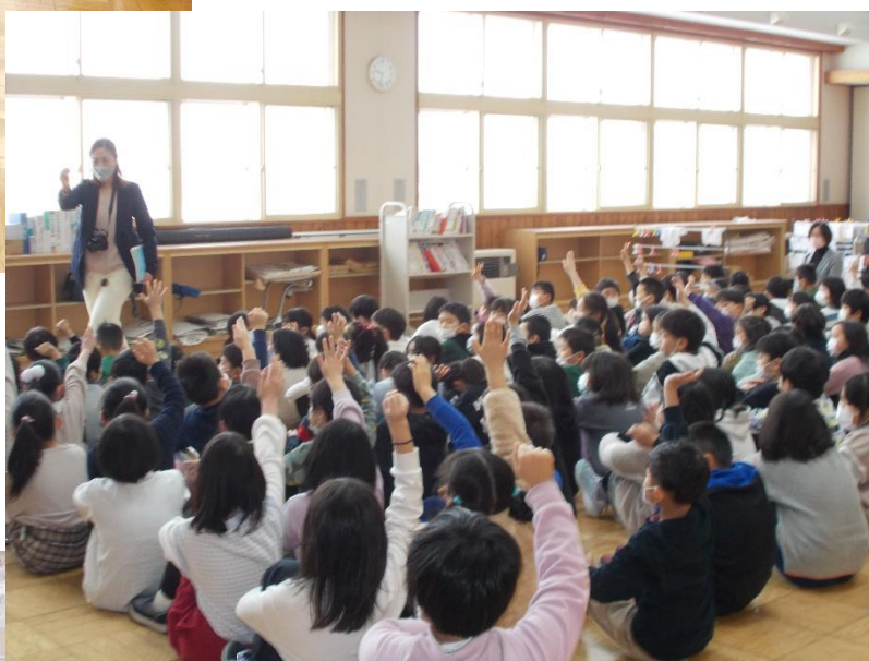
作品・研究発表会をする5年生 友だちの研究発表を聞き、質問をするクラスメイト。考えながら聞き、自分の学びを深めている素敵な姿です。