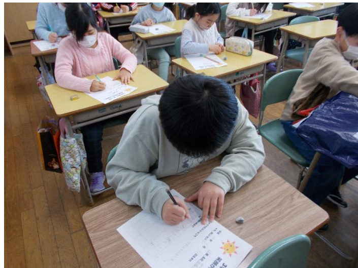
3学期の目標を立てる 3年生