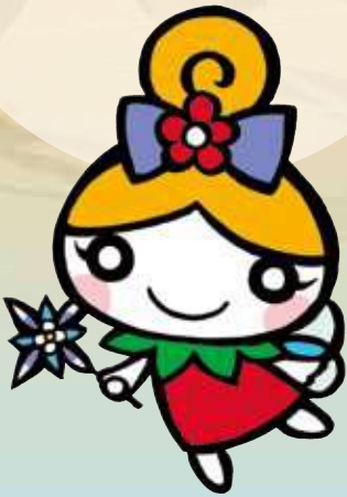
フラワーロールちゃん