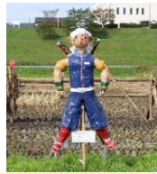
昨年度最優秀作品 鬼滅の刃「宇随天元」

産業防災部会は今年も「かかし祭りコンテスト」を開催します。皆さんから出展されたかかしは、田んぼアート会場に設置し実りの秋を彩ります。