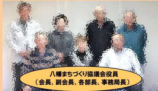
八幡まちづくり協議会役員 (会長、副会長、各部長、事務局長)

〒028-3163 岩手県花巻市石鳥谷町八幡23-147 電話&FAX 0198-45-3535