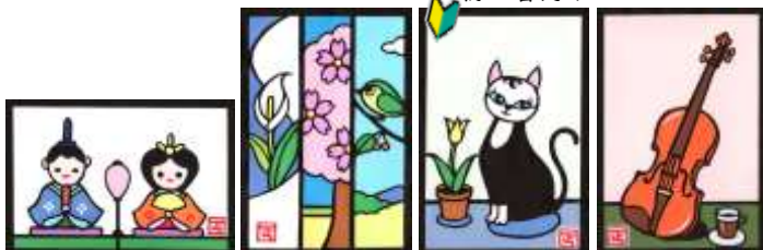
①おひな様 ②春三種 ③猫とチューリップ ④バイオリンとコーヒー