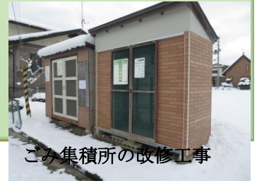
ごみ集積所の改修工事