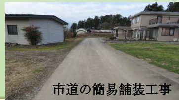
市道の簡易舗装工事