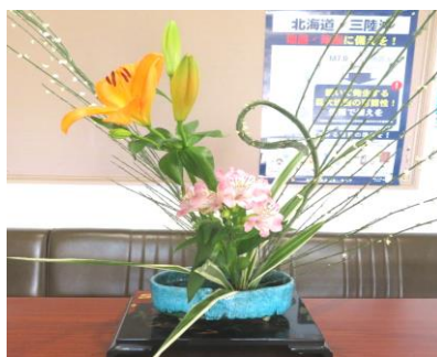
歓迎！山月会の生け花