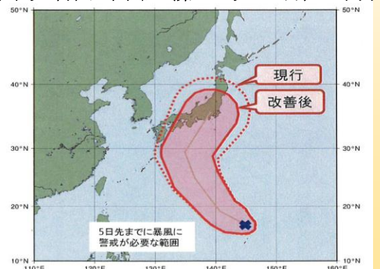
暴風警戒域の改善イメージ