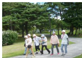
第3回目居城野公園の様子