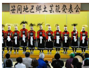
北上翔南高校鬼剣舞部