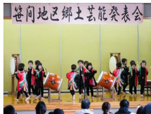
こどもげんき太鼓

花巻ささま幼稚園の「こどもげんき太鼓2023」からスタートし、笹間保育園は録音したCDのお囃子で「こども大黒舞」を舞い、6年ぶりに出演する南笹間女鬼剣舞を始め笹間地区内の8団体が熱気溢れる演舞を披露しました。今年度は招待団体に北上翔南高校鬼剣舞部を招き開催しましたが、勇壮な踊りと迫りに感動しました。出演団体の皆様は今後の郷土芸能伝承・発展活動継続への思いを新たにしていました。当日の演舞発表の写真を掲載します。