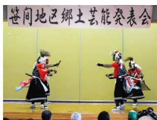
北上翔南高校鬼剣舞部