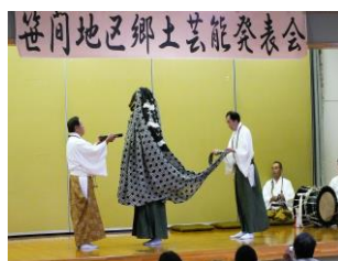
南笹間山伏神楽権現舞