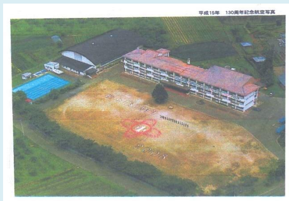
参考：平成15年「130周年記念航空写真」

完全な校章を人文字で再現するには、地域の皆様のご協力が欠かせません！ ご家族やお知り合いに卒業生がおられる方は、ぜひお声がけをお願いします。