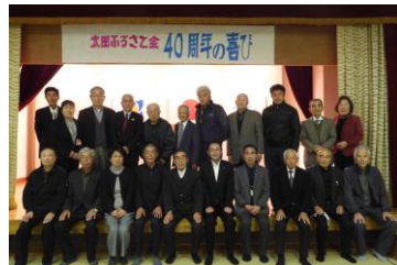
ふるさと会の皆さんと一緒に

太田ふるさと会は、発足40周年を祝う式を開催しました。昨年より取り組んできた昭和の太田の様子を収めた映像を編集し、DVD「ふるさと太田よみがえる昭和の映像」(39分)のお披露目とDVD作成にあたり協力をいただいた関係者や長年活動してきた会員へ感謝状を授与しました。