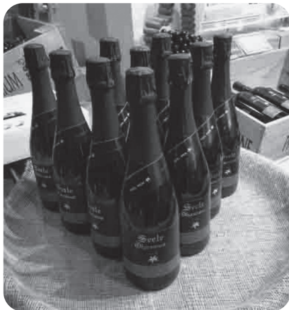
返礼品の一例「エーデルワイン」