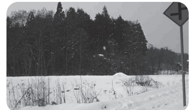
産業団地計画が進む花南地区用地