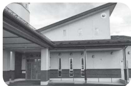
介護職の確保が求められています (写真はグループホームとどろき)

女性の新規就農者数は何人か？また、花巻版農業女子プロジェクト事業においてマルシェの出店や内部講演会が実施されているが、参加者からの意見は？