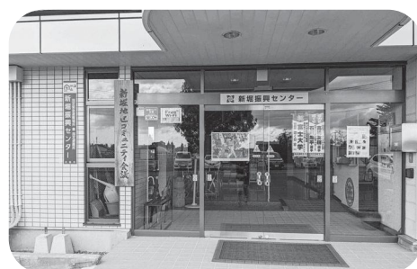
振興センターは主な避難先に指定されています

災害時の避難所になる施設であるため、エアコン設置については、今後、基準を定めながら検討していく必要があると考えている。