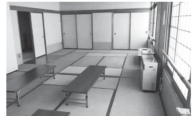
ホテルベルンドルフの改修予定の和室