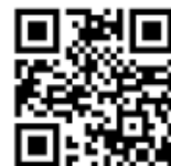
ライフプランセミナー 専用サイト