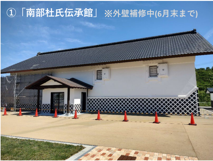
① 「南部杜氏伝承館」 ※外壁補修中(6月末まで)