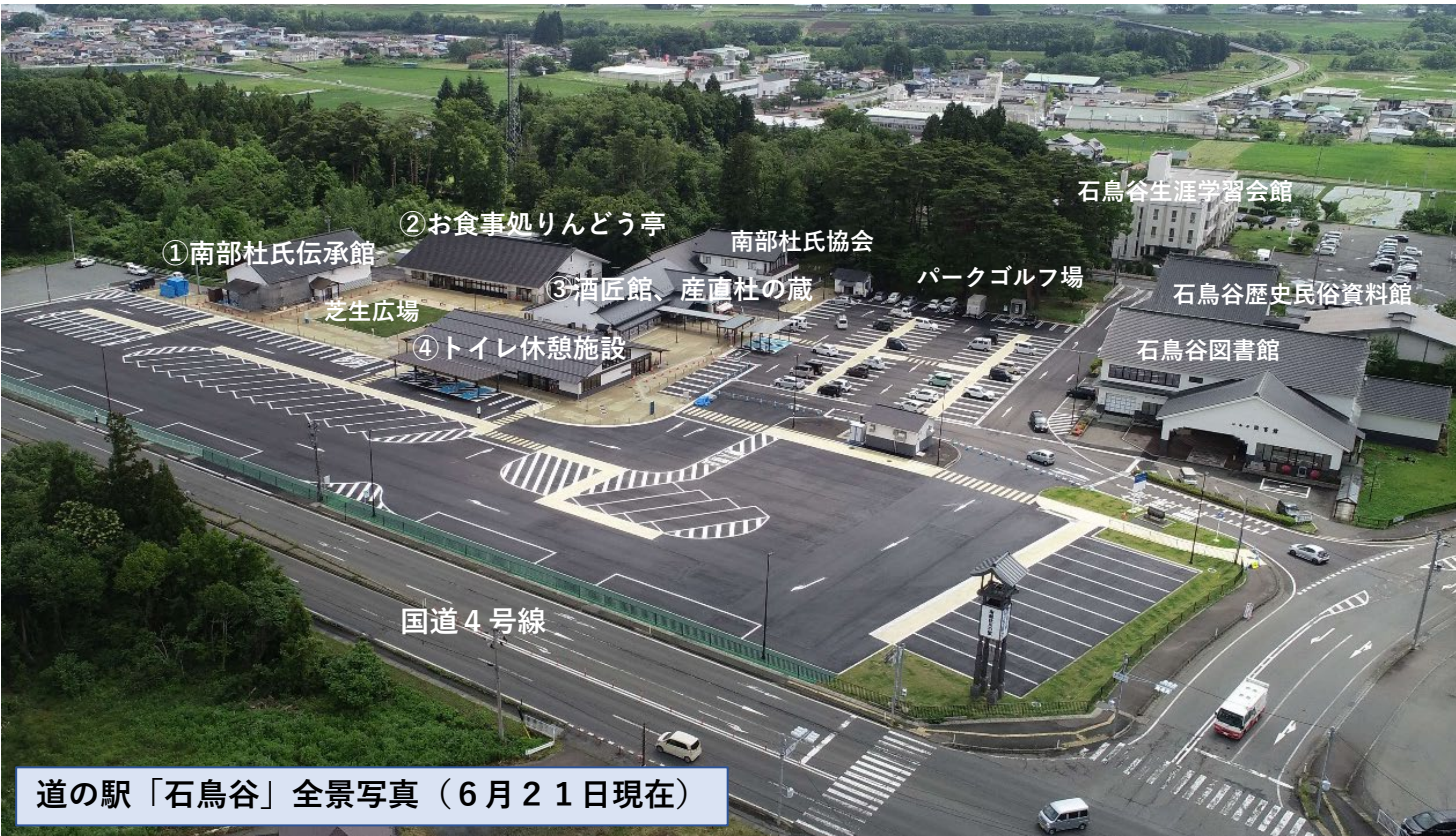
道の駅「石鳥谷」全景写真（6月21日現在）